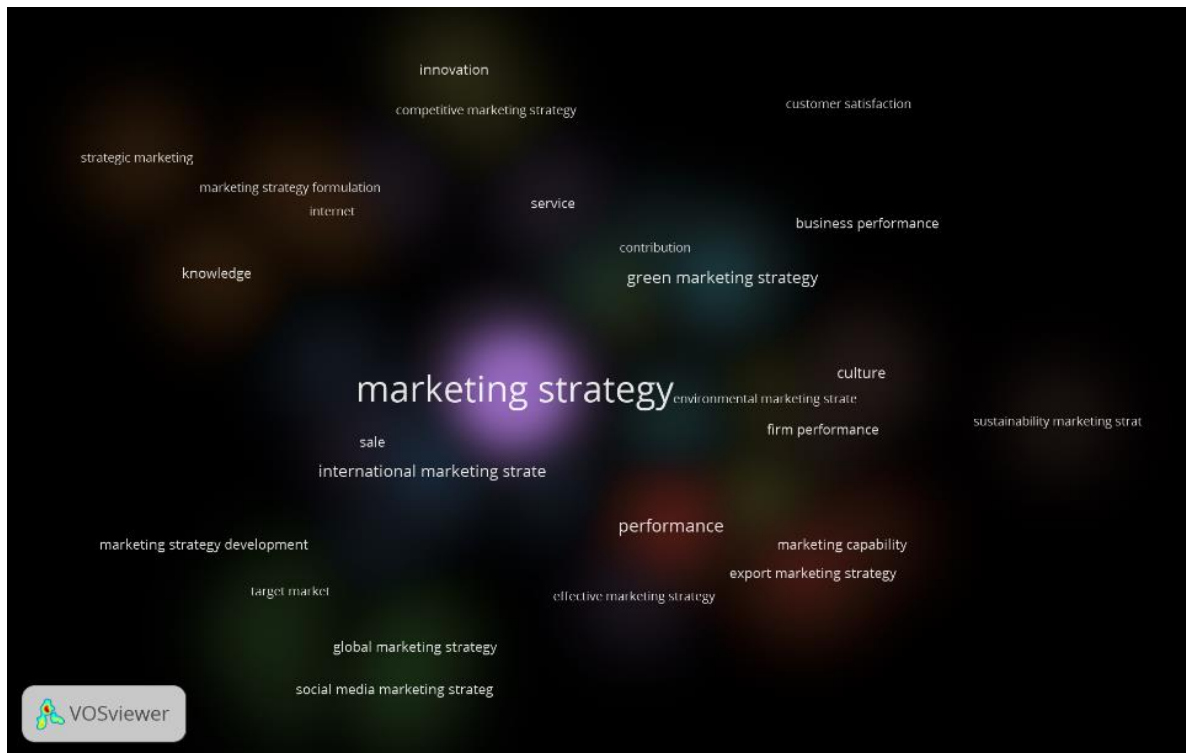
Gambar 2. Hasil Pemetaan Kluster

Secara keseluruhan, temuan yang terintegrasi memberikan pemahaman yang komprehensif mengenai riset strategi pemasaran, menyoroti tema-tema utama, penulis yang berpengaruh, dan tren yang sedang berkembang. Kesenjangan pengetahuan yang teridentifikasi menawarkan peluang berharga untuk penelitian masa depan di bidang ini. Para peneliti dapat mengembangkan pekerjaan yang sudah ada, membahas topik-topik kontroversial, dan mengeksplorasi dimensi-dimensi baru dalam strategi pemasaran, seperti pemasaran yang digerakkan oleh AI, aplikasi blockchain, dan dampak keberlanjutan terhadap perilaku konsumen.